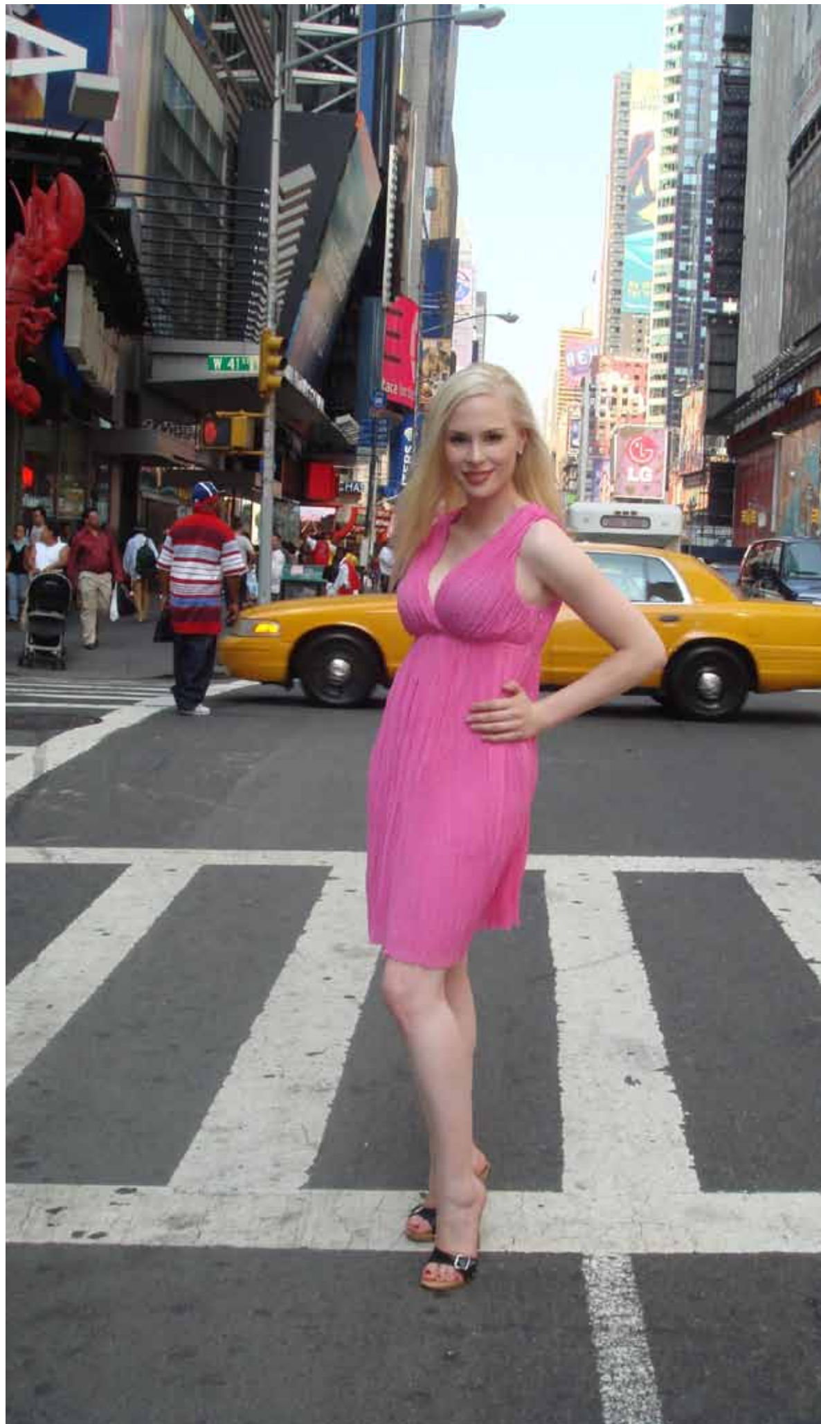
Wie Marilyn: die Vorgängerin von Paris Hilton in der Stadt aller Städte.

Mich schockiert, wie Leute private Abgründe breitwalzen. Ich finde es gut, wenn Menschen über ihre Krankheiten sprechen. Wenn sie zeigen, wie sie dagegen kämpfen, und so anderen Mut machen. Es widert mich aber an, wenn Stars im Detail über ihre Darmspiegelung reden oder ihre Geschlechtskrankheit ausführlich beschreiben. Verwerflich finde ich auch öffentliche Scheidungs- und Trennungsschlachten. Da wird mit Intimem um sich geschleudert, dass es nicht mehr lustig ist. Ein aktuelles Beispiel sind die Eheprobleme von Tiger Woods. Wobei man hier anmerken muss, dass der Golfprofi nie mit seinem Privatleben hausieren gegangen ist. Trotzdem geht seine Geschichte nun schonungslos und detailliert um die ganze Welt. Das finde ich schlimm, vor allem für seine Frau und Kinder.